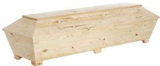
Kista i ren obehandlad furu. (Ängsro)