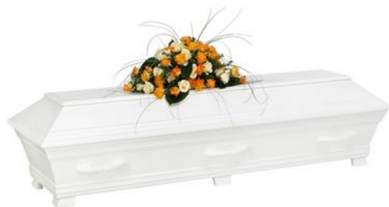
Kista furu, solidvit (Alvö)

Kistdekoration som är på bilden ingår ej.