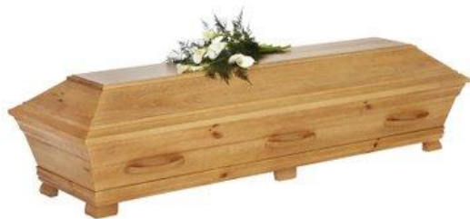
Kista i furu, ek bets. (Alvö)