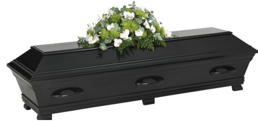
Kista furu, lackad i solidfärg, svart (Hovdala)

Kistdekoration som är på bilden ingår ej.