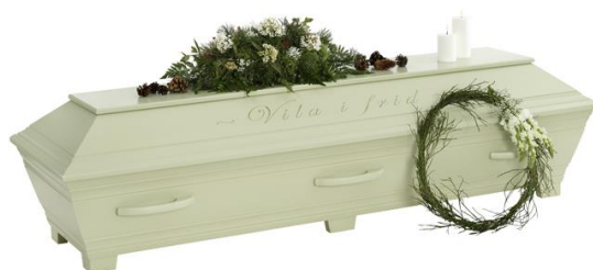
Kista furu, Lindblomsgrön (Kullamark) med avskedshälsnings ingraverad

Kistdekoration som är på bilden ingår ej.