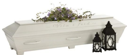
Kista i furu, målad, (Kullamark) Allmoge grå med avskedshälsning ingraverad