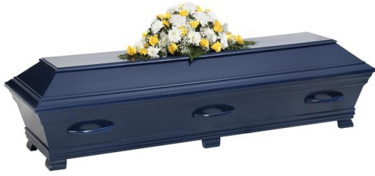
Kista i furu, lackad i solidfärg, midnattsblå (Hovdala)