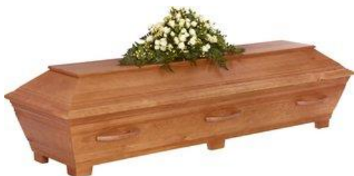
Kista i furu, målad antik brun. (Sandholm)