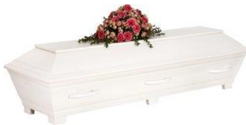
Kista furu, målad vit. (Sandholm)

Kistdekoration som är på bilden ingår ej.