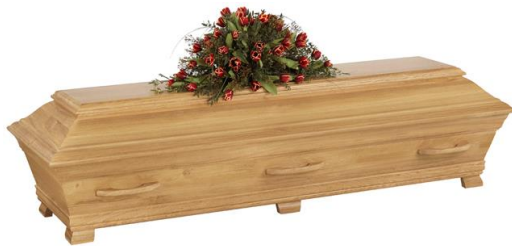
Kista i massiv ek, siden matt. (Ekenäs)