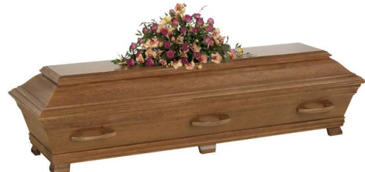
Kista i massiv ek, betsad (Ekenäs)

Kistdekoration som är på bilden ingår ej.